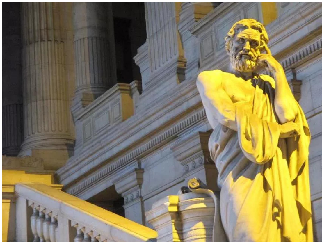
Άγαλμα Λυκούργου , Δικαστικό Μέγαρο στις Βρυξέλλες.

νυκτί με την άνοδο ή την πτώση ενός κόμματος, ενώ το σώμα του αστικού νόμου παρέμενε το ίδιο.