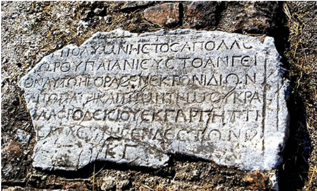
Τα Δρακόντεια Μέτρα